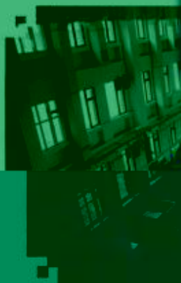
CNC 数控技术 训练场所